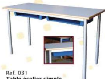
Ref. 031 Table écolier simple Dim : 60x40 H 67/70/76 Dim : 120x40 H 67/70/76