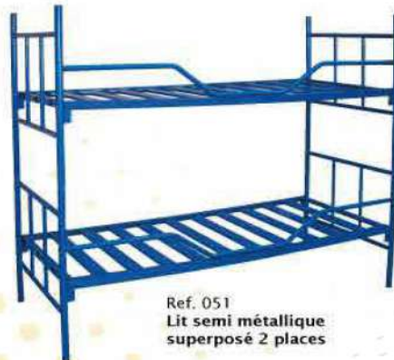
Ref. 051 Lit semi métallique superposé 2 places