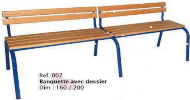
Ref. 007 Banquette avec dossier Dim : 160 / 200