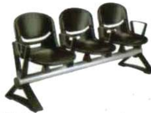
Ref. 026 Banquettes FLEX en polyuréthane sur poutre métallique de 3 places avec accoudoirs