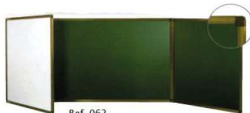
Ref. 062 Tableau magnétique vert/blanc triptyque Cadre en aluminium renforcé Dim : 400x100