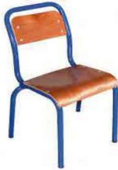
Ref. 003 Chaise semi métallique