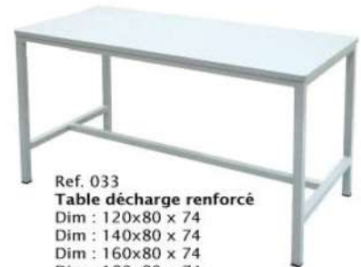
Ref. 033 Table décharge renforcé Dim : 120x80 x 74 Dim : 140x80 x 74 Dim : 160x80 x 74 Dim : 180x80 x 74 Dim : 200x90 x 74