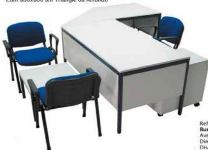
Ref. BSM 006 Bureau Informatique Avec 1 Caisson mobile de 3T Dim : 1600x800x750 Retour 800x800 Coin 800x800 (en Triangle ou Arrondi)