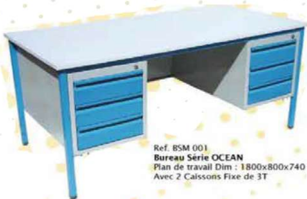
Ref. BSM 001 Bureau Série OCEAN Plan de travail Dim : 1800x800x740 Avec 2 Caissons Fixe de 3T