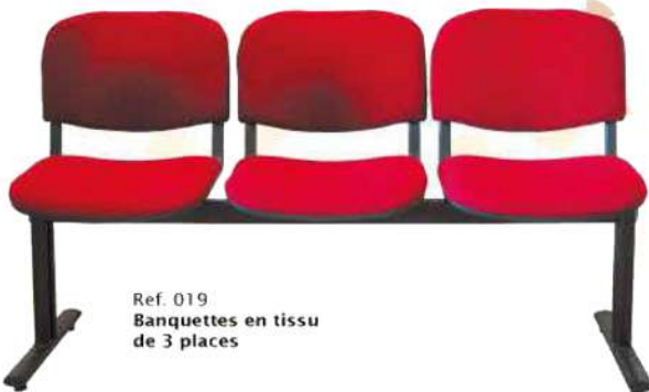
Ref. 019 Banquettes en tissu de 3 places