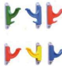
Ref. 056 Porte-Manteaux en Polypropylène Simple et Double croché