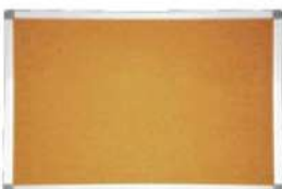
Ref. 063 Tableau d'affichage en liège cadre en aluminium Dim : 60x90/90x120/100x150