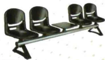
Ref. 027 Banquettes FLEX en polyuréthane sur poutre métallique de 4 places avec Tablette