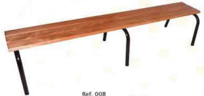
Ref. 008 Banquette sans dossier Dim : 160 / 200