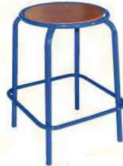
Ref. 005 Tabouret Grand