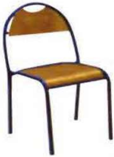
Ref. 001 Chaise dossier rond