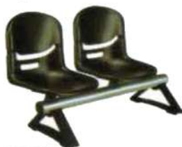
Ref. 025 Banquettes FLEX en polyuréthane sur poutre métallique de 2 places