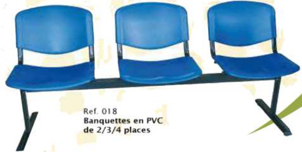
Ref. 018 Banquettes en PVC de 2/3/4 places