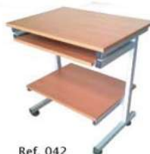
Ref. 042 Table ordinateur Dim : 80x60x75