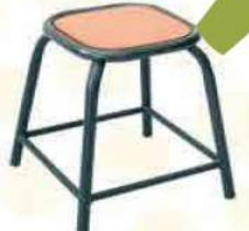
Ref. 006 Tabouret Petit