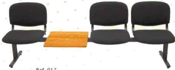
Ref. 017 Banquettes en tissu de 2/3/4 places avec tablette