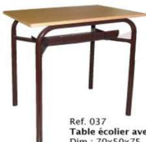
Ref. 037 Table écolier avec casier Dim : 70x50x75 Dim : 75x55x75 Dim : 80x60x75 Dim : 120x60x75