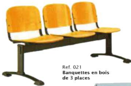
Ref. 021 Banquettes en bois de 3 places