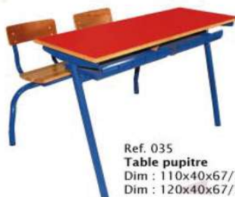
Ref. 035 Table pupitre Dim : 110x40x67/70/76 Dim : 120x40x67/70/76