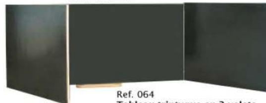
Ref. 064 Tableau triptyque en 3 volets Dim : 400x100