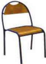
Ref. 002 Chaise petite dossier rond