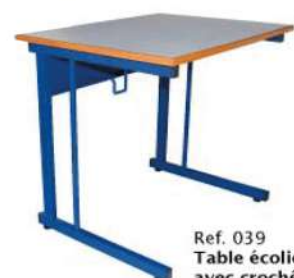
Ref. 039 Table écolier avec croché Dim : 70x50x75 Dim : 75x55x75 Dim : 80x60x75