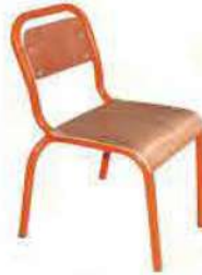
Ref. 004 Chaise petite semi métallique