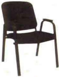
Ref. 009 Chaise visiteur avec accoudoir