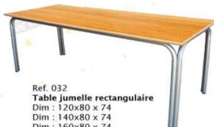
Ref. 032 Table jumelle rectangulaire Dim : 120x80 x 74 Dim : 140x80 x 74 Dim : 160x80 x 74 Dim : 180x80 x 74 Dim : 200x90 x 74