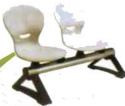
Ref. 024 Banquettes en polypropylène sur poutre métallique de 2 places