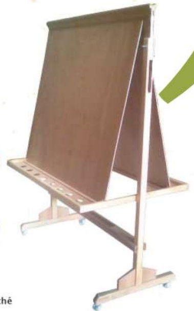
Ref. 057 Chevalet en bois sur roulettes pour 4 enfants