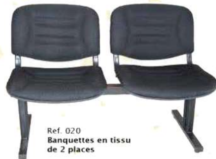
Ref. 020 Banquettes en tissu de 2 places