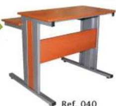
Ref. 040 Table ordinateur Dim : 120x45 - 94x32 Dim : 80x40/30 Dim : 94x32