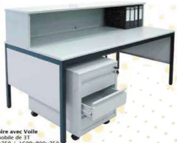
Ref. BC 007 Bureau Compotoire avec Voile Avec 1 Caisson mobile de 3T Dim : 1600x800x750 / 1600x800x750 Disponible 1200x800 / 1400x800