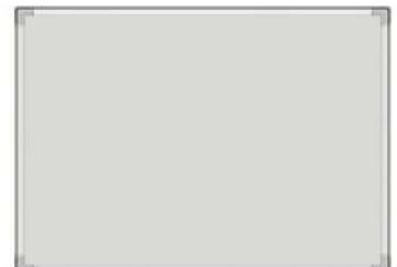
Ref. 065 Tableau Magnétique Dim : 60x90/90x120 Dim : 100x150/100x200