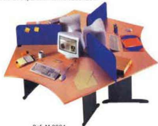
Ref. M 0004 Ensemble Bureau Triangle 3 Bureaux Dim : 1200x600x1200x600x750 3 Parois de séparation Dim : 1200x400 3 Caissons Mobiles