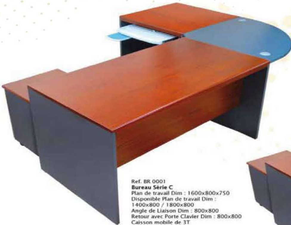
Ref. BR 0001 Bureau Série C Plan de travail Dim : 1600x800x750 Disponible Plan de travail Dim : 1400x800 / 1800x800 Angle de Liaison Dim : 800x800 Retour avec Porte Clavier Dim : 800x800 Caisson mobile de 3T