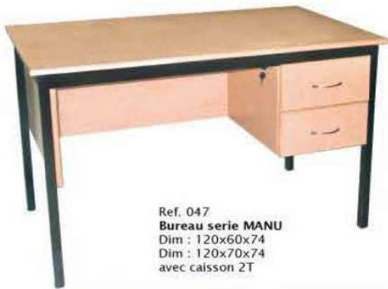
Ref. 047 Bureau serie MANU Dim : 120x60x74 Dim : 120x70x74 avec caisson 2T