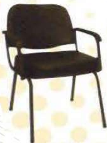
Ref. 013 Demi fauteuil