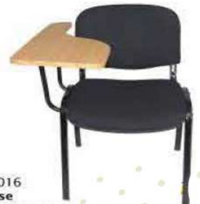
Ref. 016 Chaise avec écrioire