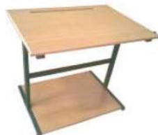
Ref. 041 Table imprimante Dim : 80x60x75