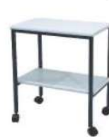
Ref. 043 Table de téléphone à 2 niveaux