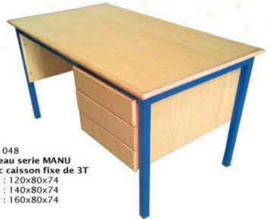
Ref. 048 Bureau serie MANU avec caisson fixe de 3T Dim : 120x80x74 Dim : 140x80x74 Dim : 160x80x74