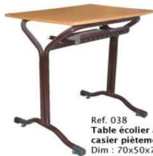
Ref. 038 Table écolier avec casier piétement en x Dim : 70x50x75 Dim : 75x55x75 Dim : 80x60x75 Dim : 120x60x75