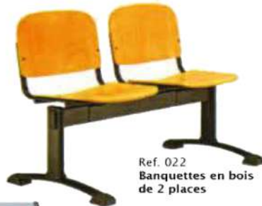
Ref. 022 Banquettes en bois de 2 places