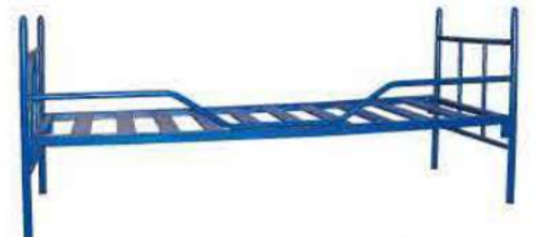
Ref. 052 Lit semi métallique 1 places