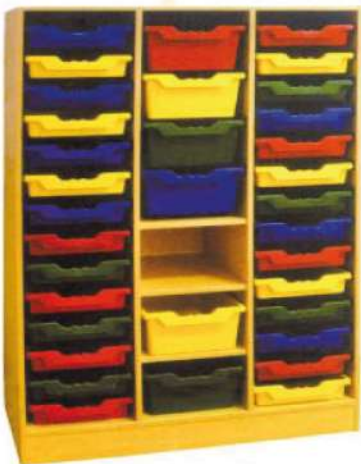
Ref. 058 Meuble de rangement en bois Plusieur Dim. disponible