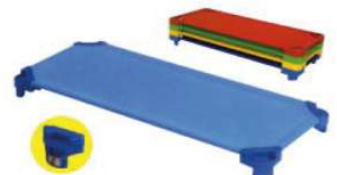
Ref. 060 Couchette empilable structure en aluminium