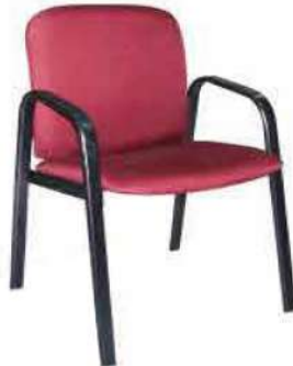
Ref. 010 Chaise visiteur avec accoudoir