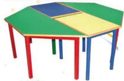
Ref. 030 Table octogonale modulable 2 tables trapézoïdales Dim : 1,20x40x60 2 table rectangulaires Dim : 60x40x60