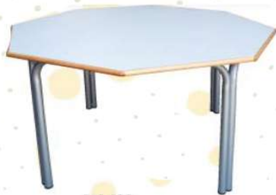
Ref. 028 Table octogonale Dim : 1,20x75