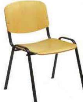
Ref. 011 Chaise visiteur Assise et dossier en bois