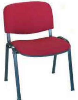
Ref. 012 Chaise visiteur