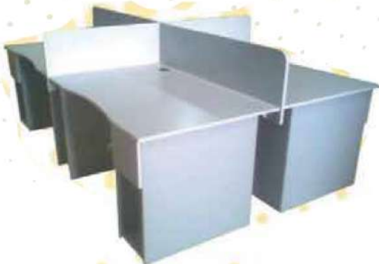
Ref. M 0001 Ensemble Poste Informatique Bureau de travail Dim : 1200x600x750