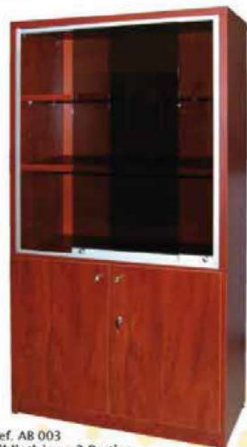
Ref. AB 003 Bibliothèque 2 Parties Vitré à Portes Coulissantes Dim : 1800x800x440 Dim : 1800x900x440