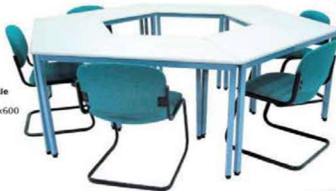
Ref. TT 005 Table Trapézoïdale pour 6 Personnes Dim : 1200x1600x600