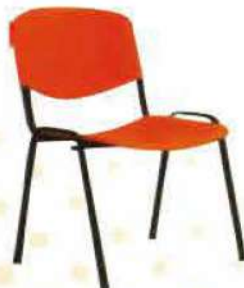
Ref. 014 Chaise visiteur en plastique