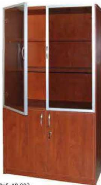
Ref. AB 002 Bibliothèque 2 Parties Vitré à Portes Battantes Dim : 1800x800x440 Dim : 1800x900x440