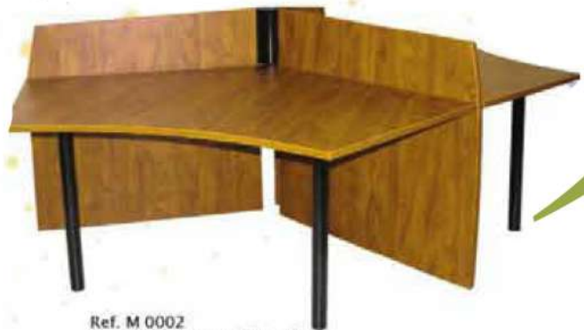
Ref. M 0002 Ensemble Bureau Triangle 3 Bureaux Dim : 1200x600x1200x600x750 3 Parois de séparation Dim : 1200x300