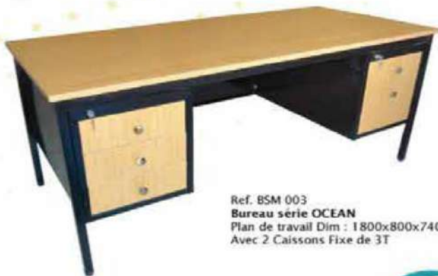
Ref. BSM 003 Bureau série OCEAN Plan de travail Dim : 1800x800x740 Avec 2 Caissons Fixe de 3T