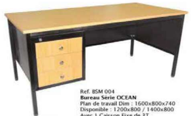
Ref. BSM 004 Bureau Série OCEAN Plan de travail Dim : 1600x800x740 Disponible : 1200x800 / 1400x800 Avec 1 Caisson Fixe de 3T