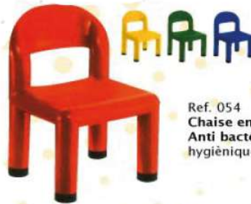
Ref. 054 Chaise en PVC Anti bactérie hygiénique