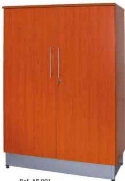
Ref. AB 001 Armoire Haute en Bois Dim : 900x800x440 Dim : 900x900x440 Dim : 1200x800x440 Dim : 1200x900x440 Dim : 1800x800x440 Dim : 1800x900x440