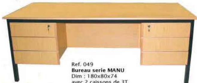
Ref. 049 Bureau serie MANU Dim : 180x80x74 avec 2 caissons de 3T