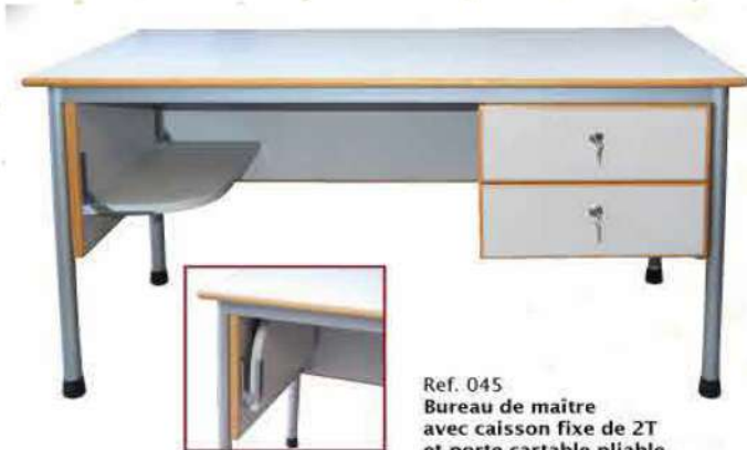
Ref. 045 Bureau de maître avec caisson fixe de 2T et porte cartable pliable Dim : 135x65x75