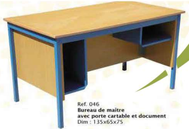
Ref. 046 Bureau de maître avec porte cartable et document Dim : 135x65x75