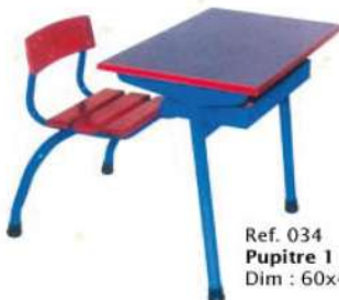
Ref. 034 Pupitre 1 place Dim : 60x40x67/70/76