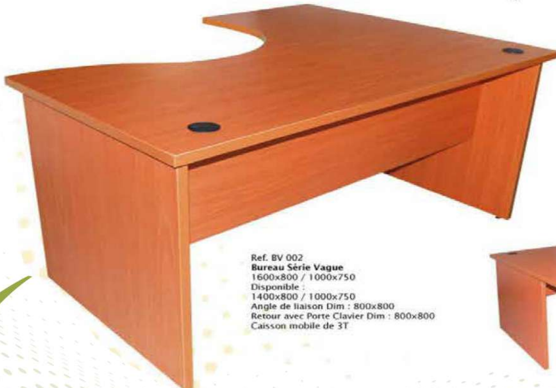
Ref. BV 002 Bureau Série Vague 1600x800 / 1000x750 Disponible : 1400x800 / 1000x750 Angle de liaison Dim : 800x800 Retour avec Porte Clavier Dim : 800x800 Caisson mobile de 3T