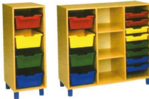
Ref. 059 Meuble de rangement en bois Pieds en PVC / Plusieurs Dim. disponible