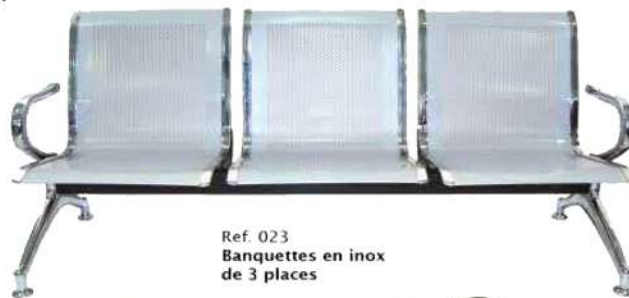
Ref. 023 Banquettes en inox de 3 places