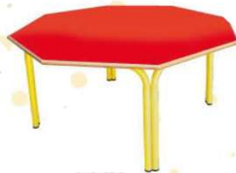
Ref. 029 Table octogonale Dim : 1,20x60