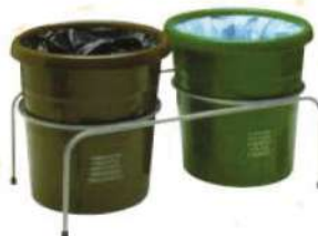
Ref. 055 Poubelle en Polypropylène