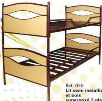
Ref. 050 Lit semi métallique et bois superposé 2 places