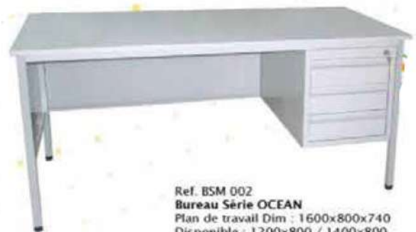
Ref. BSM 002 Bureau Série OCEAN Plan de travail Dim : 1600x800x740 Disponible : 1200x800 / 1400x800 Avec 1 Caissons Fixe de 3T