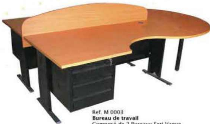
Ref. M 0003 Bureau de travail Composé de 2 Bureaux Seri Vague Dim : 1600x800 et Demi Lune