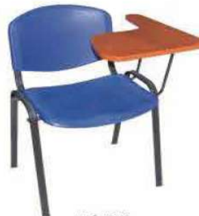
Ref. 015 Chaise en plastique avec écrioire