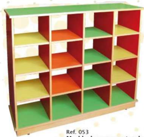
Ref. 053 Meuble de rangement en bois Dim : 120x100x40 avec 16 casiers