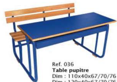
Ref. 036 Table pupitre Dim : 110x40x67/70/76 Dim : 120x40x67/70/76